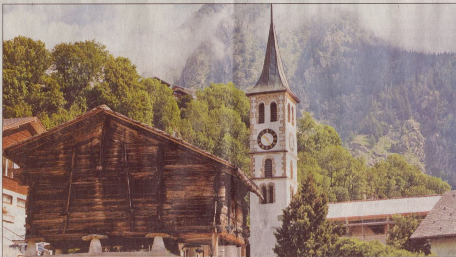
Eine Entdeckungsreise wert. Im neuen Safranmuseum in Mund dreht sich alles rund um das «rote Gold».

Ein Museum im Museum, das die Geschichte, die Gegenwart und die Zukunft des Munder Safrans preisgibt. Eingebettet zwischen den nahe gelegenen Safrankulturen und dem eigentlichen Dorfkern ermöglicht es einen Einblick in die Safrankultur, die dem Oberwalliser Dorf seine Identität gibt. Seite 3